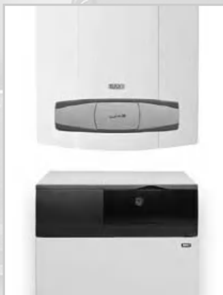
Компоновка настенного одноконтурного котла LUNA 3 Comfort с бойлером